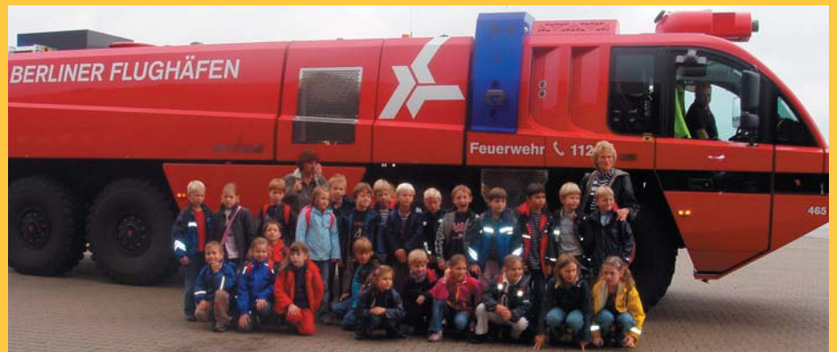
Großeinsatz in Tegel – allzeit bereit zum Klassenfoto mit Speziallöschfahrzeug

Die Klasse 2a besucht die Flughafenfeuerwehr in Tegel