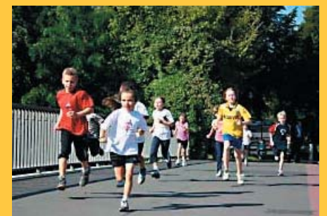
Kurz vor der Zielgeraden legen sich alle noch mal richtig ins „Zeug“!