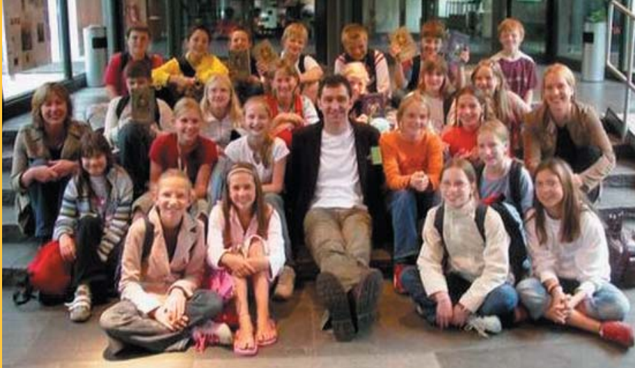
Der britische Schriftsteller Jonathan Stroud, umringt von jungen Literatur-Fans: die SchülerInnen der Klasse 6b

Die Klasse 6b war am 12. September 2005 beim Internationalen Kinder- und Jugendliteraturfestival