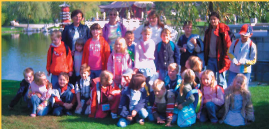
Nix für Stubenhocker: mit der Ferienbetreuung immer unterwegs, bei Sonne, Wind und Regen

Mit der Ferienbetreuung macht auch „Schule“ in den Ferien Spaß