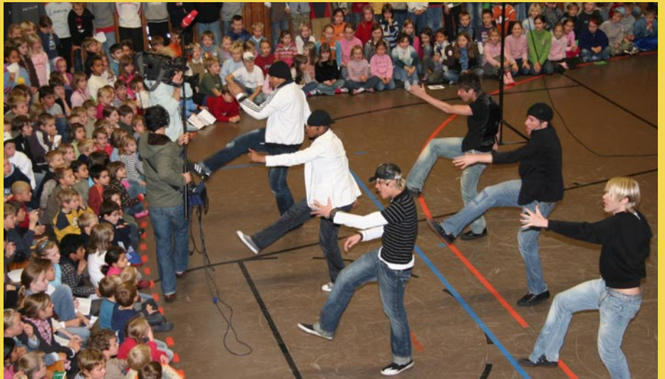
PART SIX rocken, das Kamerateam filmt – und die Kronach-Schule staunt und jubelt.

Die Boy Group PART SIX gab in der Kronach-Schule ein Konzert. Sogar das Fernsehen war mit dabei. Die KronachPost druckt den Bericht der Jungreporter von Kids-Online. Mehr Infos und Bilder und das ausführliche Interview findet ihr auf der Kronach-Website unter Kids-Online.