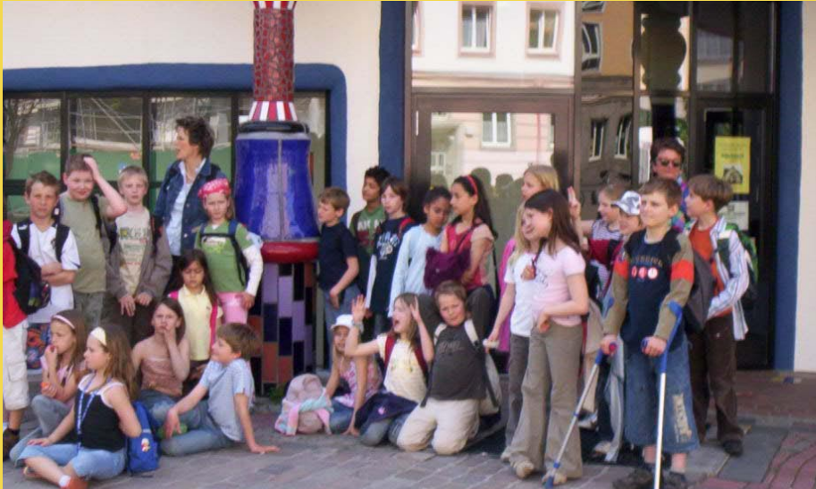
Ein wenig erschöpft, aber begeistert: Die Klasse 4b nach ihrem Besuch im Hundertwasserhaus in Magdeburg.

900 Fenster, 147 Säulen und eine Tiefgarage: Die Kinder der 4b haben dem Hundertwasserhaus einen Besuch abgestattet.