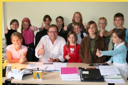
Und hier noch mal alle: Daumen hoch!

„Darüber müssen wir mal berichten“, sagten sich vor den Sommerferien die Kronach-Schüler von „Kids-Online“, die schon seit Langem in ihrer AG Berichte für die Schul-Homepage machen. Sie haben bereits Schauspieler wie Ben Becker interviewt, Popstars wie die Jungs von Tokyo Hotel getroffen – und sie waren im Olympiastadion beim Fußball. So fuhr im Juli die Kinderredaktion nach Babelsberg zu den Radiomachern. Journalisten berichten über Journalisten – also.