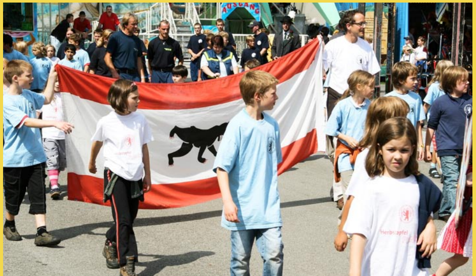
Festlicher Umzug mit Bären-Banner: Die Kronach-Schüler vertreten Berlin auf dem Schützenfest in Kronach.

Die Kronach-Schüler aus Berlin erlebten wieder mal eine aufregende Ferienwoche in der Partnerstadt.