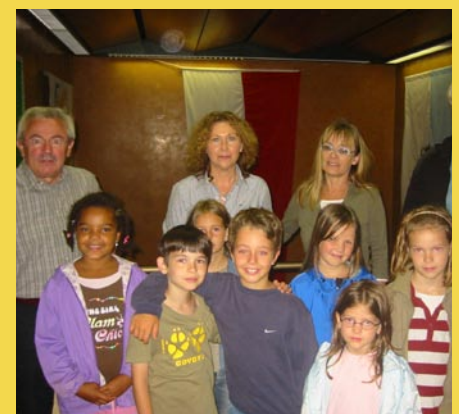
Blumen und Ständchen: Dankeschön an den Bürgermeister und sein Sekretariat.