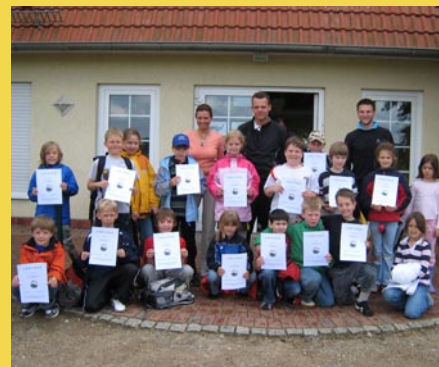
Die neue Generation Golf: AG-Schüler mit Diplom.

Ein Golfprojekt vom Golfclub Gross Kienitz und der Vereinigung clubfreier Golfer (VcG).