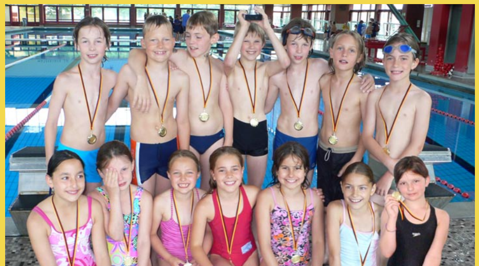
Gewinnermedaillen und Gewinnerlachen: Die Kinder der Kronach-Staffel haben es geschafft!

Die Kronach-Schule hat nicht nur gute Läufererinnen und Läufer. Auch die Schwimmer dominieren!