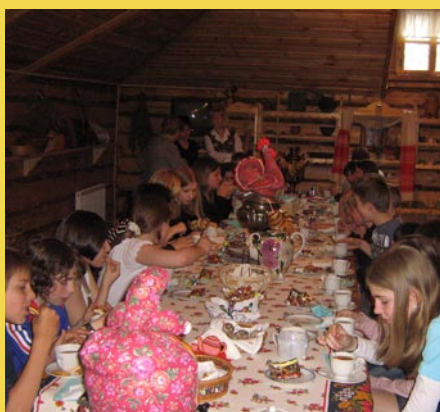
Bei einer russischen Teezeremonie.

Auch in diesem Jahr waren die Reisenden begeistert – vor allem von der russischen Herzlichkeit.