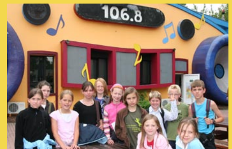
Das Haus von Radio Teddy in Form eines Radios.