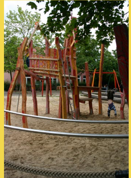
... und meistens ist hier mehr los.

Doch das Gerüst soll nicht die letzte große Anschaffung für die Kronach-Schule sein. Jetzt sammelt der Förderverein Geld für ein schönes und vor allem auch lautes Klavier. Die Entscheidung fiel in Absprache mit den Musiklehrerinnen und der Schulleitung. Der Grund für die