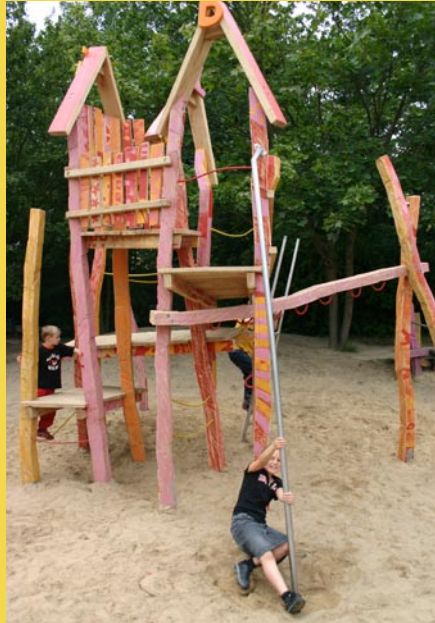
Hier können sich die Kinder so richtig austoben ...

Zwei Großprojekte in einem Jahr! Nach dem Klettergerüst arbeitet der Förderverein nun daran, dass die Schule ein neues Klavier bekommt.